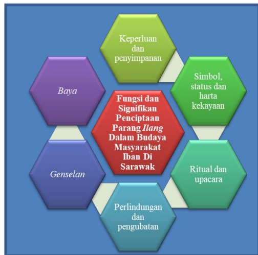
Rajah 1. Fungsi dan signifikan penciptaan parang Ilang dalam budaya masyarakat Iban di Sarawak.