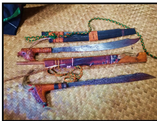
Gambar 1. Parang Ilang sebagai salah satu keperluan penyimpanan dalam budaya masyarakat Iban di Sarawak.

tersendiri dalam budaya masyarakat Iban. Tambahan pula, dalam setiap adat istiadat, ritual dan upacara kebudayaan masyarakat Iban, maka mereka akan mempamerkan objek-objek tersebut sebagai suatu set simbol, identiti diri dan sebagai pelengkap kepada aktiviti yang dijalankan tersebut. Ini kerana kuasa-kuasa luar biasa yang diseru tidak akan datang dan membantu masyarakat Iban sekiranya tidak mempamerkan Pua Kumbu , parang Ilang dalam Rajah 1 dan Tajau (tempayan). Sehubungan dengan itu, penyimpanan objek-objek tersebut amat penting bagi sesebuah keluarga dalam masyarakat Iban agar sentiasa terlindung dan memperoleh kerestuan, kekayaan dan dijauhi gangguan kuasa jahat.