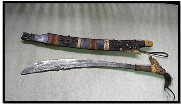
Rajah 3. Parang Ilang yang hampir berusia ratusan tahun yang disimpan sebagai pusaka Iban (Sumber: Koleksi parang Ilang milik informan Datuk Sri Edmmund Langgu, 2023).

Berdasarkan kepada elemen-elemen sakral pada parang Ilang masyarakat Iban, ia dapat dilihat melalui aspek fungsi dan simbol. Bagi aspek simbol pada parang Ilang , ia dapat digolongkan sebagai perlambangan dalam amalan ritual dan upacara di samping amalan kepercayaan warisan masyarakat Iban di rumah panjang mereka. Manakala, aspek fungsi pula merujuk keupayaan parang Ilang dalam membantu dan menghindari masyarakat Iban daripada terkena dengan malapetaka buruk seperti wabak penyakit berjangkit, musibah buruk, pengaruh roh jahat serta keselamatan mereka selagi memiliki objek tersebut yang bertindak sebagai pelindung dan penjaga. Manakala, bagi elemen bukan sakral pada parang Ilang , lazimnya ia berfungsi sebagai kraf perhiasan atau produk kraftangan serta sebagai peralatan pertanian oleh masyarakat Iban itu sendiri.