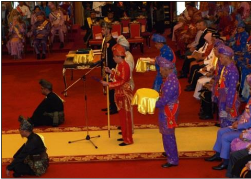
Gambar 4. Menandatangani Aakuan Sumpah.