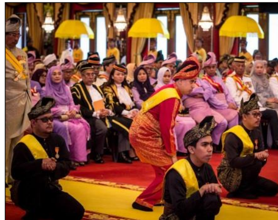
Gambar 6. Menerima keris kuasa.