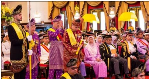
Gambar 8. Menyembahkan Persembahan.