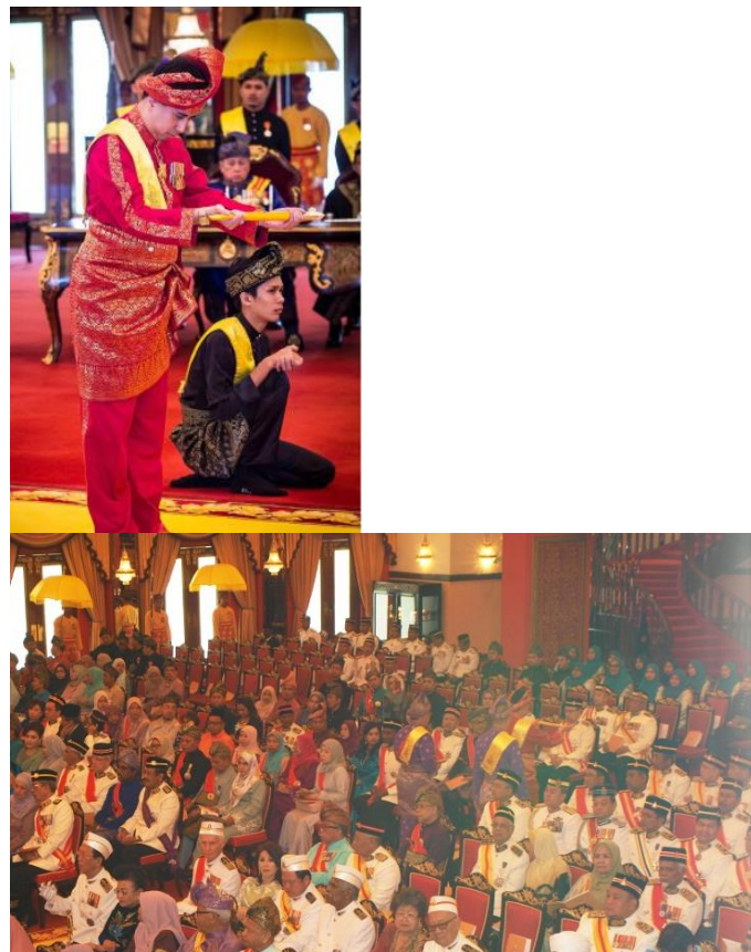
Gambar 7. Menerima keris kuasa.

Gambar 7 adalah cara menerima keris kuasa dan berundur dengan tertib. Penerima perlu menundukkan kepala apabila berada dalam keadaan memerlukan mengangkat sembah. Dari di tempat permulaan menjunjung duli, penerima perlu berpusing ke belakang dari arah jam dan terus keluar menaiki kenderaan di luar Balai Rongseri bagi menjalankan Adat Menyorok selama tempoh larangan berkuatkuasa iaitu 7 hari.