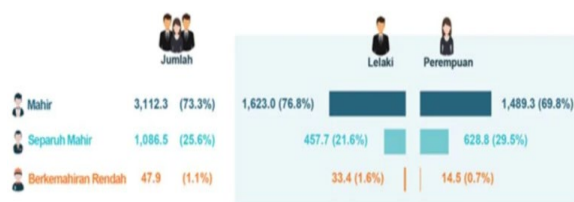
Rajah 3: Siswazah bekerja mengikut tahap kemahiran dan jantina

Berdasarkan kepada data yang telah dikeluarkan oleh Jabatan Perangkaan Malaysia, didapati bahawa bilangan siswazah yang bekerja pada tahun 2019 telah meningkat walaupun mempunyai kadar peratusan yang sama seperti tahun 2018. Statistik bilangan siswazah yang telah bekerja telah menunjukkan bahawa graduan yang telah dihasilkan oleh institusi pendidikan kita adalah menepati apa yang telah dikehendaki oleh industri masa kini. Perkara ini adalah bertentangan dengan MPEN (2010) yang menyatakan bahawa kekurangan kemahiran berserta rungutan tentang kurangnya kreativiti dan kemahiran berbahasa Inggeris secara konsistennya adalah rintangan utama yang dihadapi oleh firma industri. Malah lambakan siswazah dalam pasaran buruh bukan sahaja