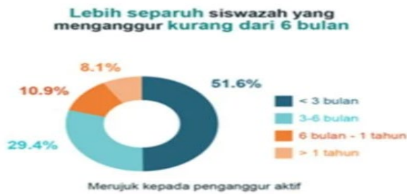
Rajah 2: Tempoh siswazah mendapatkan pekerjaan setelah tamat pengajian

Dari aspek tahap kemahiran, kebanyakan siswazah bekerja dalam kategori mahir, iaitu sebanyak 73.3 peratus (3.11 juta orang), bersesuaian dengan kelayakan mereka sebagai siswazah. Manakala siswazah bekerja dalam kategori separuh mahir mewakili 25.6 peratus atau 1.09 juta orang pada tahun 2019. Statistik siswazah bekerja mengikut tahap kemahiran dan jantina telah ditunjukkan seperti dalam Rajah 3.