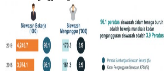
Rajah 1: Perbandingan statistik siswazah bekerja dan siswazah menganggur bagi tahun 2018 dan 2019

Menurut Jabatan Perangkaan Malaysia, bilangan siswazah yang bekerja telah meningkat sebanyak 6.9 peratus pada 2019 kepada 4.25 juta orang daripada tahun 2018 (3.97 juta orang). Sebanyak 96.1 peratus siswazah dalam tenaga buruh adalah bekerja. Walaupun statistik siswazah yang bekerja telah meningkat pada tahun 2019, bilangan siswazah yang menganggur turut meningkat sebanyak 5.58 peratus pada tahun 2019 kepada (170,300 orang). Tetapi kadar peratusan siswazah yang menganggur pada tahun 2018 dan 2019 adalah sama iaitu sebanyak 3.9 peratus. Statistik ini telah ditunjukkan seperti dalam Rajah 1.