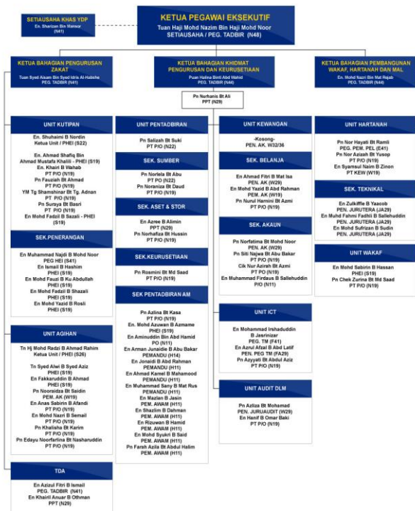
Gambar Rajah 1. Carta Organisasi MAIPs

sokongan. Ketiga-tiga bahagian utama tersebut adalah Bahagian Khidmat Pengurusan dan Keurusetiaan, Bahagian Pengurusan Zakat dan Bahagian Pembangunan Wakaf dan Hartanah Mal. Berikut adalah penambahbaikan yang dilakukan pada struktur organisasi MAIPs bermula tahun 2018 hingga 2020: