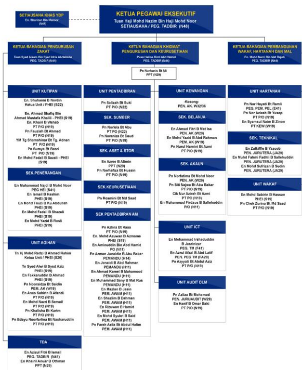
Gambar Rajah 1. Carta Organisasi MAIPs