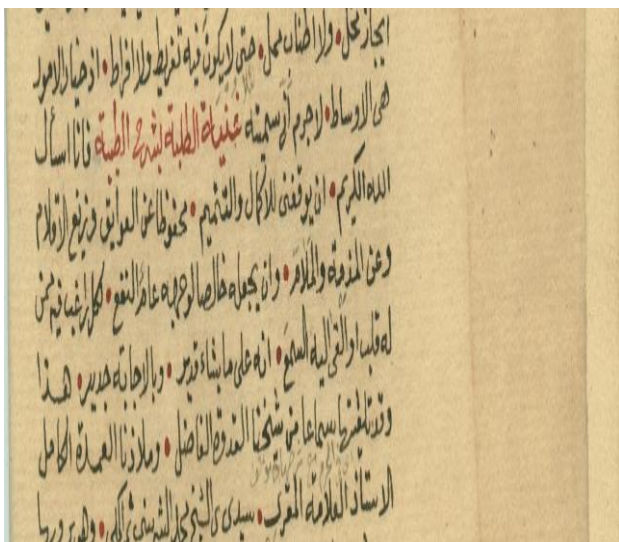
Jadual 2: Manuskrip Ghunyat Al-Talabah Bi Sharh Al-Tayyibah

Sebagai kesimpulan, Jika dibandingkan dengan kitab-kitab qiraat beliau yang lain, Ghunyat bolehlah dianggap sebagai ensiklopedia al-Tarmasiy dalam bidang qiraat. Ini berikutan isinya mengandungi qiraat Imam Sepuluh berpandukan Manuskrip Tayyibat al-Nashr fi al-Qira'at Al- c Ashr karangan Ibn al-Jazariy berbanding dengan kitab-kitab beliau yang lain dalam bidang ini.