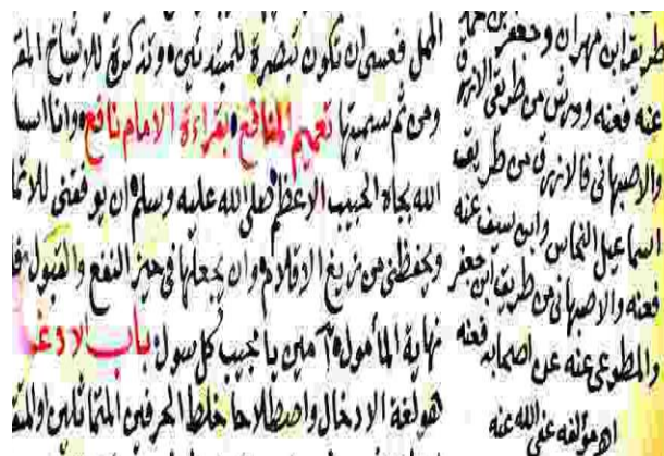
Jadual 1: Manuskrip Ta°mim Al-Manafi° Bi Qira°at Al-Imam Nafi°

Terdapat juga kitab-kitab rujukan lain oleh pelbagai pengarang yang disebutkan di dalam manuskrip Ta°mim ini. Sejumlah 12 bab menempatkan nama karya-karya mereka yang pada kebiasaannya dinakalkan oleh al-Tarmasiy ketika merujuk kitab Ithaf .