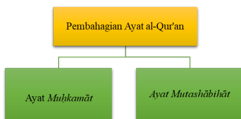
Rajah 2. Pembahagian ayat al-Qur'an

Erti sebenar ayat al-Qur'an yang ingin disampaikan oleh Allah tidak dapat dijelaskan berdasarkan akal manusia semata-mata. Bahkan kaedah pembacaan bagi ayat ini juga turut diperselisihkan oleh ulama-ulama muktabar. Sesetengah ulama membahaskan perihal tempat berhenti bagi ayat di atas. Antara persoalan yang ditimbulkan adalah adakah tempat berhenti bagi ayat di atas terletak selepas kalimah Allah ( illa Allah ) ataupun persoalan yang kedua adakah selepas perkataan "golongan yang mendalam pengetahuannya ( wa al-Rāsikhūna fī al-ʿIlm )?"