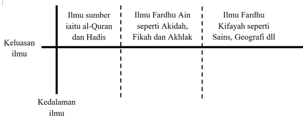
Rajah 2: Keluasan dan Kedalaman Ilmu untuk Proses KBAT

Contohnya, sumber daripada al-Quran menceritakan mengenai proses penciptaan manusia dalam rahim ibu (Ghafir, 40: 67). Orang yang mengkaji